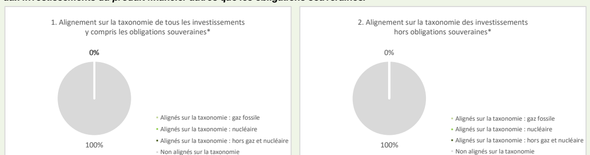
Ce graphique représente 2% des investissements totaux

Les deux graphiques ci-dessous font apparaître en vert le pourcentage minimal d'investissements alignés sur la taxonomie de l'UE. Étant donné qu'il n'existe pas de méthodologie appropriée pour déterminer l'alignement des obligations souveraines* sur la taxonomie, le premier graphique montre l'alignement sur la taxonomie par rapport à tous les investissements du produit financier, y compris les obligations souveraines. Le deuxième graphique représente l'alignement sur la taxonomie uniquement par rapport aux investissements du produit financier autres que les obligations souveraines.